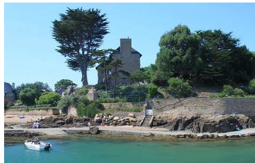
Ile de Brehat