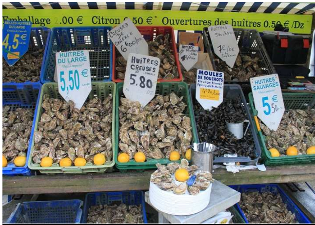
ostriche a Cancale