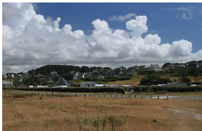
il camping visto dalla scogliera

Lasciamo la Cotes d'Armor ed entriamo in Finistere, puntando decisamente verso Brest. Il traffico è pressoché nullo pur essendo sabato e superiamo agevolmente la città dirigendoci verso l'oceano in direzione Lampaul-Plouarzel , dove arriviamo all'ora di pranzo. Facciamo un giro sulla costa per valutare le diverse possibilità di sosta, che qui sono veramente abbondanti. Vediamo in pochi km due aree attrezzate e due camping municipali, tutti vicini al mare. Il luogo è davvero bello, anche grazie colori alla giornata con cielo limpido e venticello fresco. Scogliere si alternano a spiagge bianche, che danno al mare colori bellissimi. Scegliamo per la nostra sosta il Camping Municipal di Plouarzel, più per la posizione che per altro. È tutto su prato, c'è il parco giochi, ed è a ridosso di una bellissima lingua di sabbia bianca, collegata con una bellissima passeggiata sulla scogliera ad altre due spiagge.