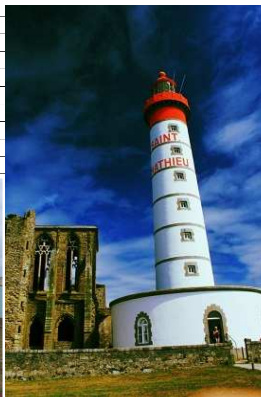
Point Saint Mathieu

05/08-lun Lun 5.. Anche oggi, tempo pessimo. Nuvoloni neri, volano alla velocità della luce sopra le nostre teste. Usciamo dalla penisola del Crozon e raggiungiamo Locronan , dove ci fermiamo per una visita al vecchio borgo Bretonne, ottimamente conservato. Giacche anti pioggia e ombrelli aperti, visitiamo alla bell'e meglio i vicoli e la piazzetta sferzati dal vento.