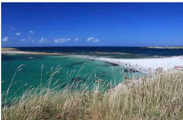
la spiaggia vista dalla scogliera

L'addetto comunale non c'è, quindi ci parcheggiamo, pranziamo e poi andiamo in spiaggia. Solo al nostro rientro scopriamo il prezzo di 14.40€. Non poco (ovviamente per la media francese) considerando che è praticamente un'area di sosta e che