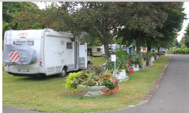
Camping Bléré Plage

28/07-dom Lasciamo questa parentesi di Valle della Loira per puntare decisamente verso la Bretagna. Sempre evitando le autostrade e percorrendo le bellissime statali, passiamo per Chateau-la-Villiere, La-Lude, La-Flèche, Sablé, Laval, Ernée, ed arriviamo a Le-Mont-Saint-Michel , nostra destinazione di oggi, che anche se si trova geograficamente in Normandia, è la porta naturale per la Bretagna. Anche il clima è già tipicamente bretone, con vento freddo e nuvoloni minacciosi. Passiamo davanti a diverse aree di sosta e parcheggi, ma per maggiore vicinanza al Monte, optiamo per il Camping du Mont Saint Michel che si trova all'interno della zona già chiusa al traffico. Per accedervi, bisogna telefonare al camping (+33-0233602210) che vi rilascerà un codice che dovrete presentare