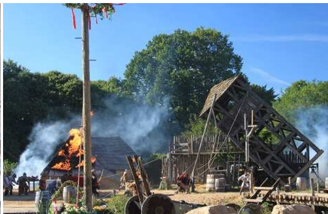
i prezzi del parco