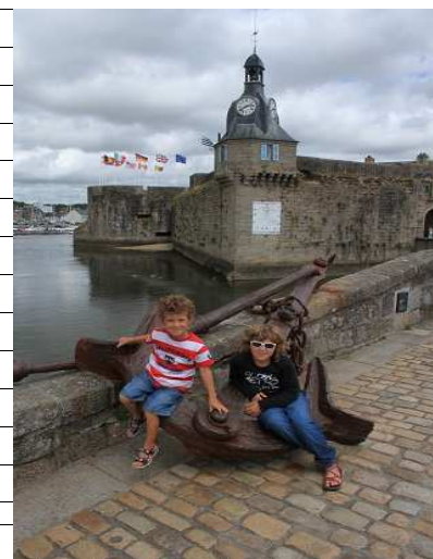
la Ville Close

Ormai è sera, e ci infiliamo in uno di questi parcheggi, già mezzo pieno di altri camper.