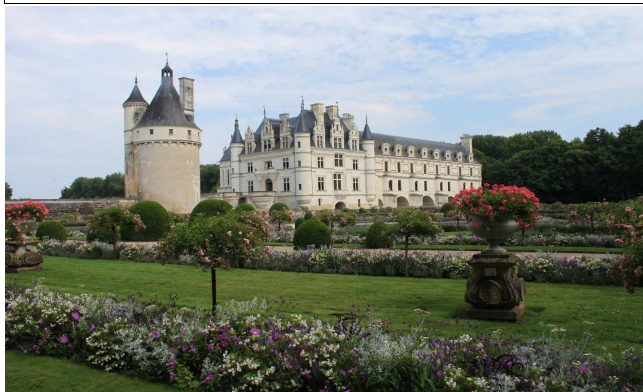
il castello di Chenonceaux

27/07-sab Meta del giorno, raggiungere la Loira ed i suoi castelli. Resto in autostrada fino a Macon (circa 200km, autostrada A40), poi li esco e non ci entrò più. Il percorso che avevo pianificato, nel dettaglio è : N79 fino a Moulins, N7 fino a saint-Pierre-le-Moutier, D2076 fino a Bourges e poi Vierzon, ed infine la D976 fino al castello di Chenonceaux . Da Macon, sono 360km di statali. Si attraversa un bella regione rurale, con mucche al pascolo e campi di grano sterminati. Strade statali stupende, diritte che sembrano tracciate col righello, a due corsie ma che si alternano a tratti a quattro corsie. Raggiungiamo il Castello di Chenonceaux sulla Cher, che visitiamo (30.50€ due adulti e un bambino oltre gli 8 anni). Visita piacevole, sia all'interno che all'esterno, con i giardini bellissimi ed il bel parco dove fare sfogare i bambini. Poi consultiamo le fide guide di aree e camping e a 6 km dal castello, decidiamo di fermarci al Camping Bléré Plage (Aire de la Gatine), una sorta di camping municipale, ubicato nel centro sportivo del paese, sul fiume. Si può dunque usufruire delle strutture del centro e quindi piscina, tennis, minigolf ecc.. Per i clienti del camping la piscina costa 2€ gli adulti e 1€ i bambini, così come il minigolf.. Camping semplice e tranquillo, su prato verde e con belle aiuole. Molto pulito e silenzioso. Paghiamo in tutto 16.70€, prezzo tipicamente "francese".