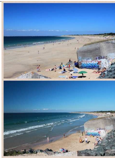
alta e bassa marea

12/08-lun Il sole ci dà il buongiorno anche oggi e quindi rimaniamo sull'isola, deciso. Però cambiamo paese; torniamo verso sud ed in pochi km raggiungiamo Le Bois Plage en Re , dove in 10 metri ci sono ben 3 possibilità di sosta: il Camping Les Amis de la Plage, con piscina e tutto il resto (a circa 26,00 €), una AA sempre dello stesso camping con 35 posti (a 12,10€), e poi, di fronte alle due strutture, un P per camper con 15 posti (gratis). Troviamo posto nel P gratis, e ci sistemiamo.