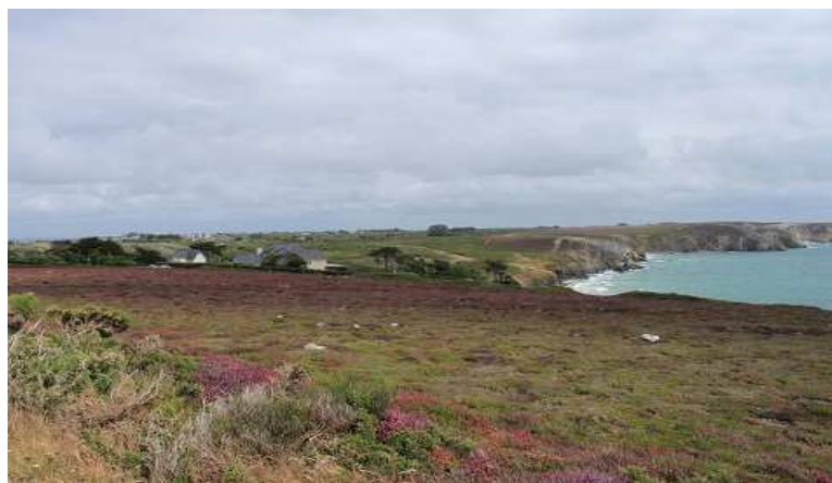
Point de Penhir

Più tardi riusciamo anche a fare una passeggiata in paese a Camaret, a curiosare per le gallerie d'arte e a mangiare un gelato al porto turistico, e poi ci rifugiamo in camper per la serata. Poco dopo, altre nuvole coprono il cielo, e ricomincia a piovere.